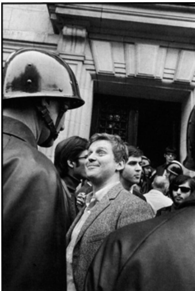
Daniel Cohn-Bendit devant la Sorbonne, 6 mai 1968

Vous commenterez cette photographie de Gilles Caron en interrogeant le statut emblématique de l'image ainsi que la place du photographe au sein d'un événement.