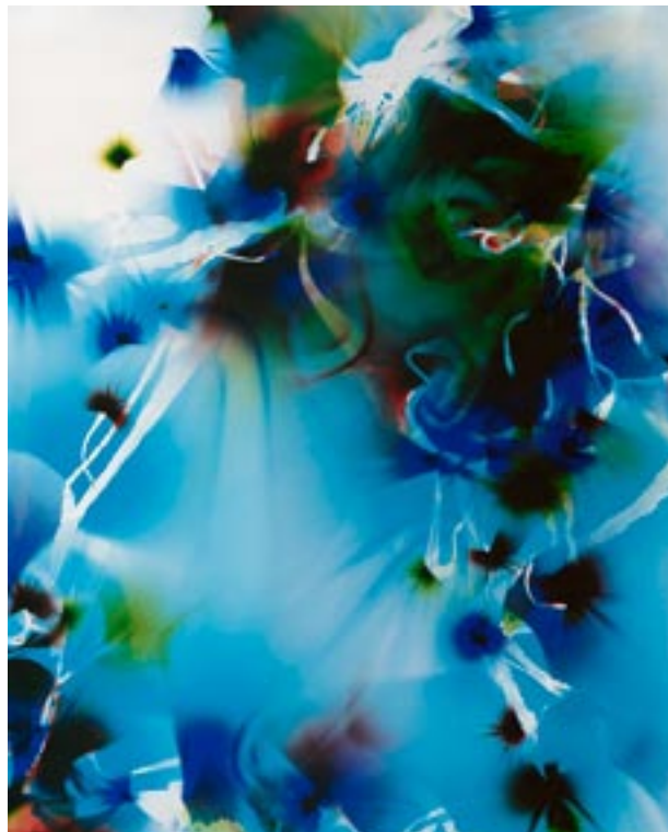
Wolfgang Tillmanns, Mental Picture n°2 , 2000